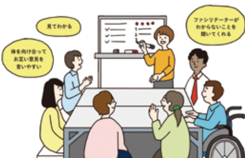
ホワイトボード・ミーティング®のイメージ

ホワイトボードを活用して進める話し合いの方法です。進行役をファシリテーター、参加者をサイドワーカーと呼びます。ファシリテーターが意見をホワイトボードに書くことで、ひとりひとり意見を活かす話し合いを効率的、効果的に進めます。2003年にちょんせいこが開発し、ビジネス、教育、医療、福祉、行政、市民活動など幅広い領域で取り組まれています。